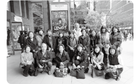
会場 梅田芸術劇場他 (出席者 21名)