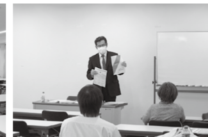
10/22 決算説明会 大同生命ビル