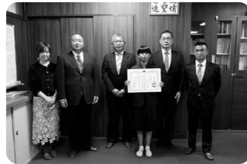
岡山西納税貯蓄組合連合会 税に関する中学生の作品 表彰式 令和3年11月25日 岡山市立桑田中学校