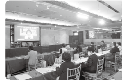
会場 ラヴィール岡山 (出席者 19名)

29日 県法連/法人会女性セミナー<井笠大会> 会場 ラヴィール岡山 (出席者 19名)