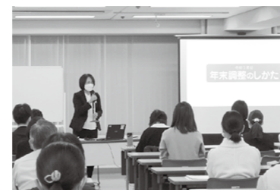
11/17 年末調整説明会 第一セントラルビル1号館