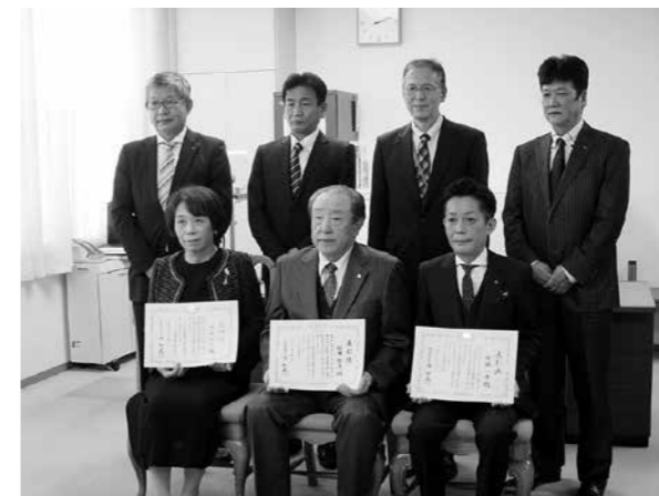
令和3年11月12日 集合写真