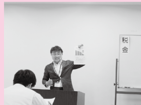
青年部会・女性部会合同 租税教室 模擬講座 11月8日 (大同生命ビル)

次代を担う児童・生徒の皆さんに、税がこの社会で果たしている役割の重要性を正しく理解し、関心をもていただくため、租税教育用テキストの配布や、青年部会員・女性部会員が「租税教室」を実施するなど、多彩な租税教育活動を展開しています。