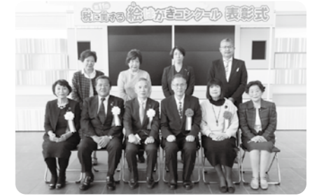
会場 ひかりの広場