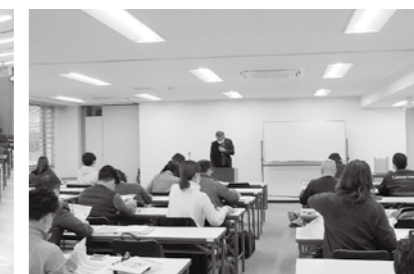
12/7 新設法人説明会 大同生命ビル