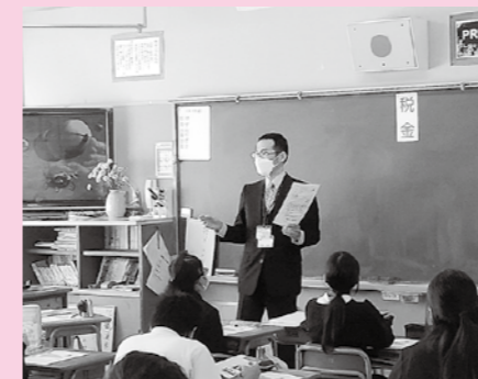
青年部会 租税教室 11月12日 (妹尾小学校)