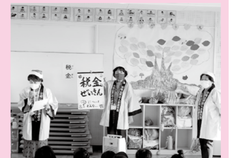
女性部会 租税教育活動 12月24日 (鹿田バンビクラブ)