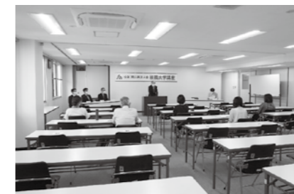
10/5~10/8 税務大学講座 大同生命ビル

岡山西法人会では税に関する研修会を開催しています。会員以外の方も参加していただけますので、日程等はHPで確認をして事務局へお申込みください。