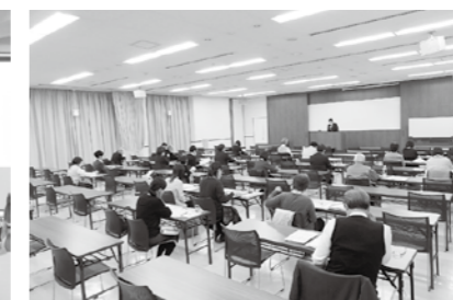
11/30 第49回税務講習会 岡山商工会議所