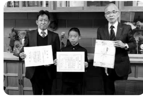
岡山市租税教育推進協議会 税に関する中学生の作品 表彰式 令和3年11月22日 岡山市立伊島小学校