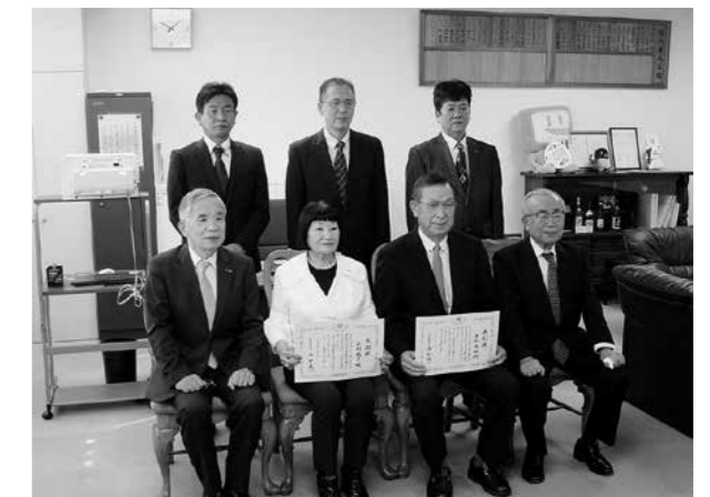
令和3年11月15日 集合写真