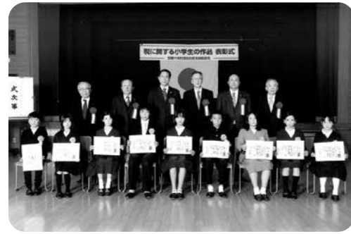
吉備中央町租税教育推進協議会 税に関する小学生の作品 表彰式 令和3年11月16日 下竹荘公民館

岡山西法人会でも『税を考える週間』に合わせて女性部会が署幹部との座談会を開催し、税の使われ方や税法の改正事項などについて話し合いました。