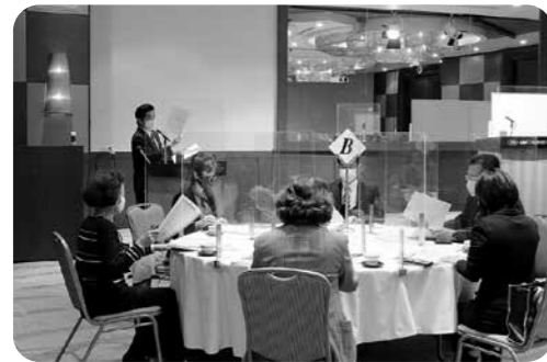
女性部会 岡山西税務署幹部との座談会 令和3年11月25日 ANAクラウンプラザホテル岡山