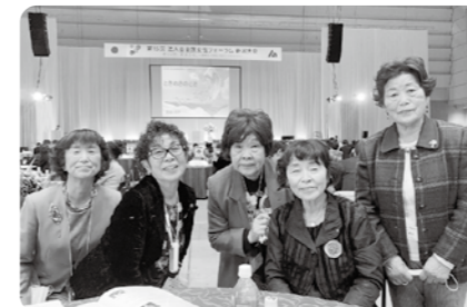
会場 朱鷺メッセ (出席者 4名)