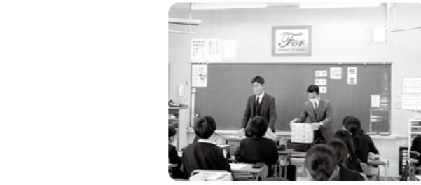
会場 岡山市立大元小学校(参加児童 157名)